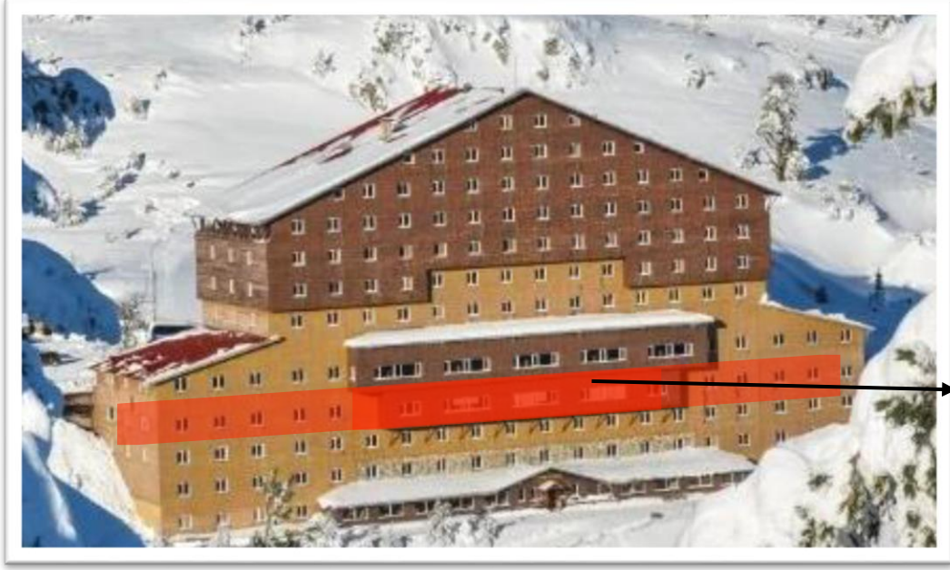
Fotoğraf 3: Otelin arka cephe görünümü ve yangının başlangıç yeri